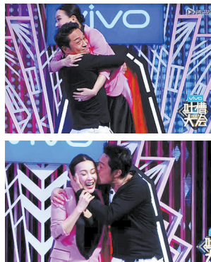
《吐槽大会》视频截图