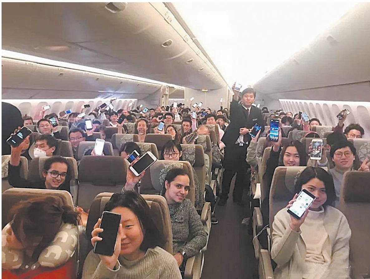
1月18日，东方航空第一班开放使用手机的航班上，乘客集体记录下历史性一刻。(东方航空微博)

东航方面表示，目前能够提供空中Wi-Fi服务的空中互联网机队规模已达到74架，覆盖全部国际远程航线及166条国内重点商务航线，东航目前拥有国内最大的具备Wi-Fi功能的机队。如旅客选择乘坐东航提供Wi-Fi服务的飞机，可在舱门、机身、客舱内部发现Wi-Fi标识。通过提前在东方航空APP或东航官网上申请登录密码，旅客可在登机后打开手机Wi-Fi功能连接东航空中互联网络。Wi-Fi服务目前是免费提供。(金羊)