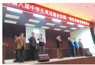
跟着金牌老师学英语

马克·斯特兰德，一生获奖无数，其诗歌被翻译成30多种语言。他被称为“深沉的异化哀悼者”，他以深刻的智慧讲述了有关现代生活的孤独、被异化、焦虑，以及面对广阔世界时的无力感。《我们生活的故事》完整收录了斯特兰德前半生6部重要的诗集，辑录的108首佳作包括广为流传的《食诗》《美好生活》《献给父亲的挽歌》等名篇。