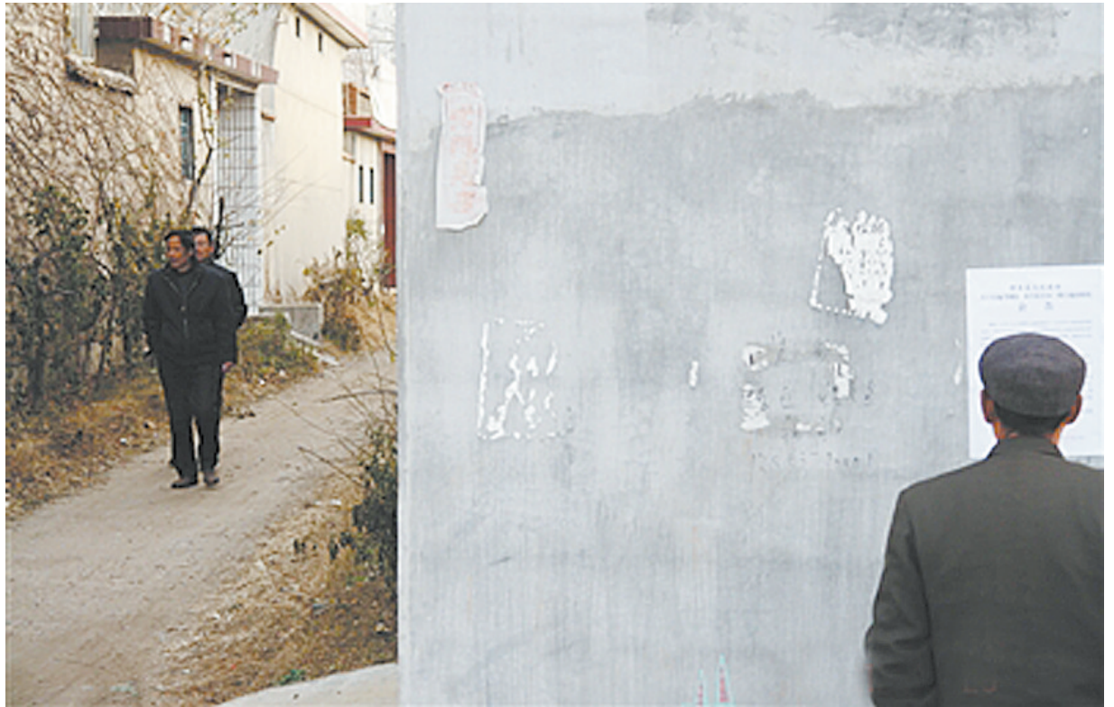
2012年,泗水县人民政府发布《泗水县人民政府关于实施考棚街、西关街片区一期土地征收的公告》。但在2011年9月,山东省政府已作出了批准用地申请的批复。

据《新京报》报道,因对政府征地拆迁中的做法不满,山东省济宁市泗水县30名农民向作出批复的山东省政府申请行政复议,在省政府作出维持批复的决定后,他们又向国务院申请最终裁决。日前,国务院作出行政复议裁决,确认山东省政府在该征地项目中的批复违法。