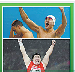
基础大项游泳、田径再获突破