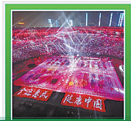
第十三届全运会成功举行