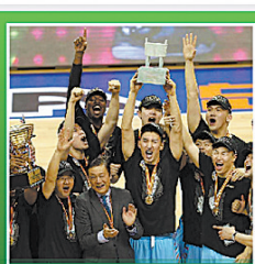
新疆首次夺得CBA冠军