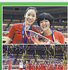
中国女排时隔16年再夺大冠军杯