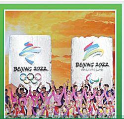
北京冬奥会会徽发布