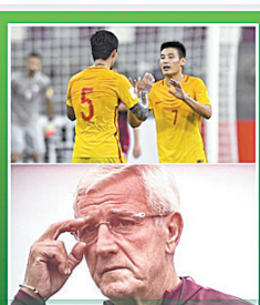
中国足球持续进步