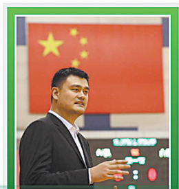
体育改革持续深化

12月15日,2022年北京冬季奥林匹克运动会会徽“冬梦”和冬季残奥会奥林匹克运动会会徽“飞跃”在国家游泳中心“水立方”发布。北京冬奥会会徽“冬梦”以汉字“冬”为灵感来源,北京冬残奥会会徽设计则展现了汉字“飞”的动感和力度。