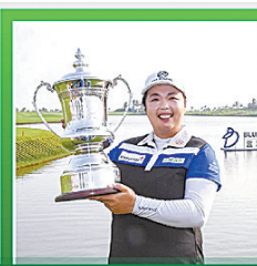
冯珊珊排名女子高尔夫球世界第一