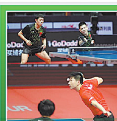
乒乓球运动员弃赛受处罚