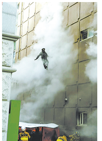
在消防队员的帮助下,一男子从高层成功跳楼逃生。

据新华社首尔12月21日电 韩国消防部门21日晚说,当天发生在韩国忠清北道堤川市一运动中心的火灾已造成29人死亡,死亡人数仍有可能上升。