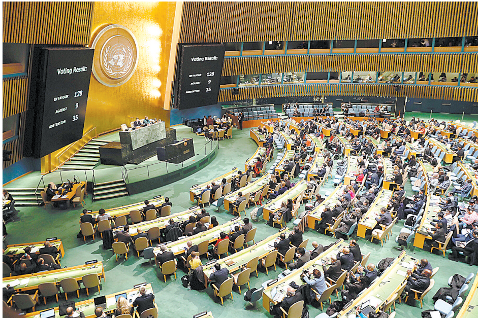
这是12月21日在位于纽约的联合国总部拍摄的联合国大会紧急特别会议现场。联合国大会21日以压倒性多数投票通过一项决议,认定任何宣称改变耶路撒冷地位的决定和行动“无效”。

以色列1967年占领东耶路撒冷后,单方面宣称整个耶路撒冷是其“永久且不可分割的首都”,而巴方则要求建立一个以东耶路撒冷为首都的巴勒斯坦国。国际社会普遍不承认以色列对耶路撒冷拥有主权,很多和以色列有外交关系的国家把使馆设在特拉维夫而非耶路撒冷。