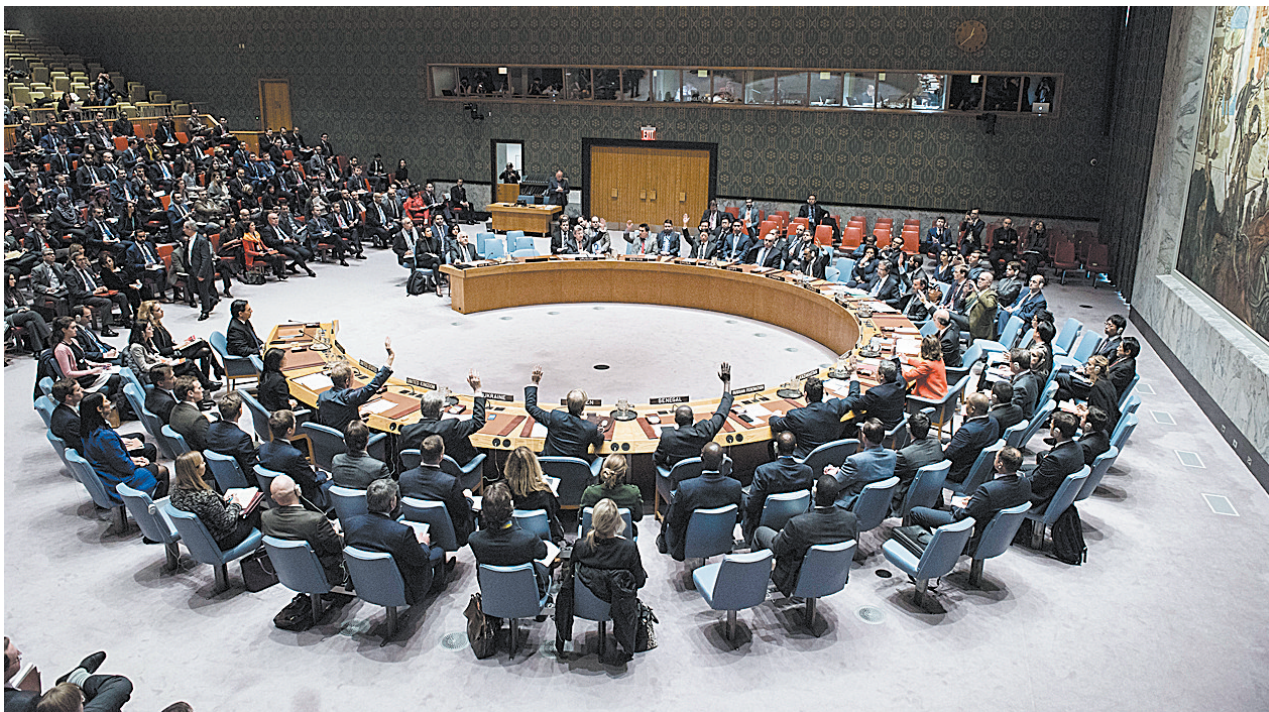
12月18日在位于纽约的联合国总部拍摄的安理会会议现场

新华社联合国12月18日电 美国18日投票否决联合国安理会关于耶路撒冷地位问题的决议草案。