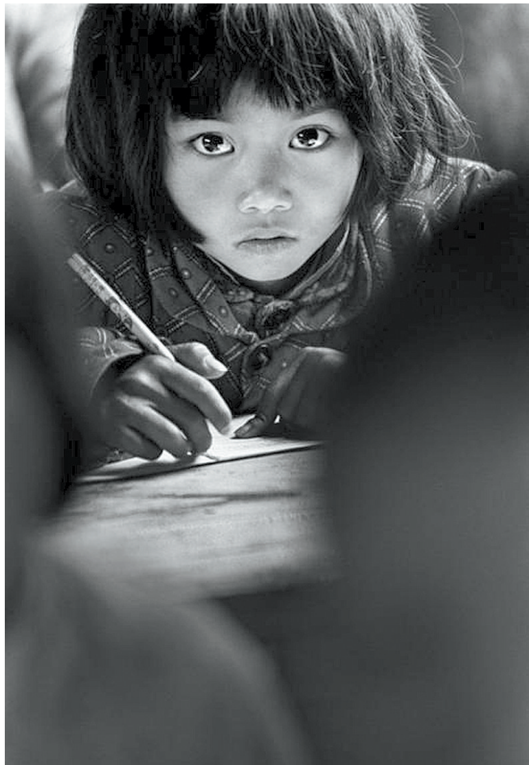
当年的“大眼睛”感动中国