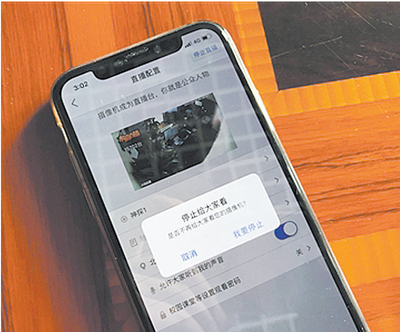
◀12月12日,一家公司正在使用一款由360公司生产的摄像头。使用者可通过程序控制权限。(资料图)

对于360团队的回应,《一位92年女生致周鸿祎:别再盯着我们看了》一文作者陈菲菲表示,监控和直播是两回事,用户在公共场所出于安防等需求所设置的监控,不等于可以直播和无限度公开,除非征得所有被直播人的同意,或是基于公共安全考虑,“这份回应依然在回避被直播的事实”。