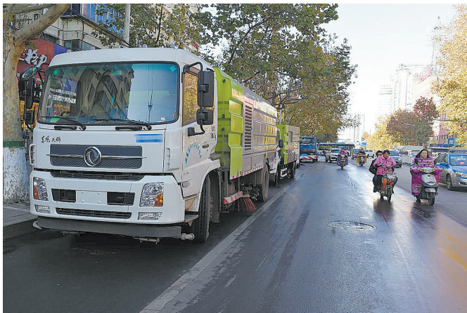
洒水车停靠慢车道，骑车市民只得绕行。

就此，记者致电卫东区环卫局，工作人员杜女士说，开源路与矿工路交叉口是他们与市自来水公司协商好的一个取水点。以前清扫车辆都是“干扫”，现在为防止扬尘，都是“湿扫”，所以之前只有洒水车取水，现在清扫车也要取水，车辆会比较多。“更更换取水点要与市自来水公司协商，把车停到停车场也需要与相关方面协商。对于市民的建议，我们先向领导反映吧”。