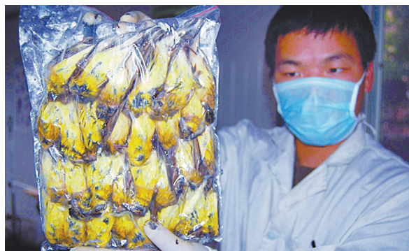
浙江苍南林业部门执法人员截获的黄胸鹀。

后,这类野鸟都是通过非法手段捕获的,其捕获手段不排除使用毒饵,此前曾有人类食用毒饵捕获的野鸟后中毒的案例。“食用来历不明的野鸟,徒增食品安全风险,不可取。”