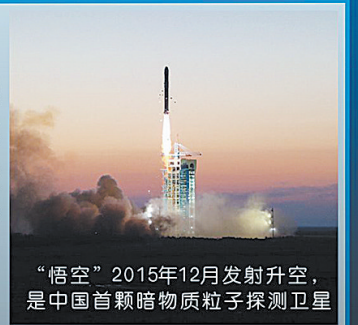
“悟空”2015年12月发射升空,是中国首颗暗物质粒子探测卫星

与国际上类似的空间探测器相比,“悟空”在“高能电子、伽马射线的能量测量准确度”以及“区分不同种类粒子的能力”这两项关键技术指标上处于领先地位,特别适合寻找暗物质粒子湮灭过程产生的一些非常尖锐的能谱信号