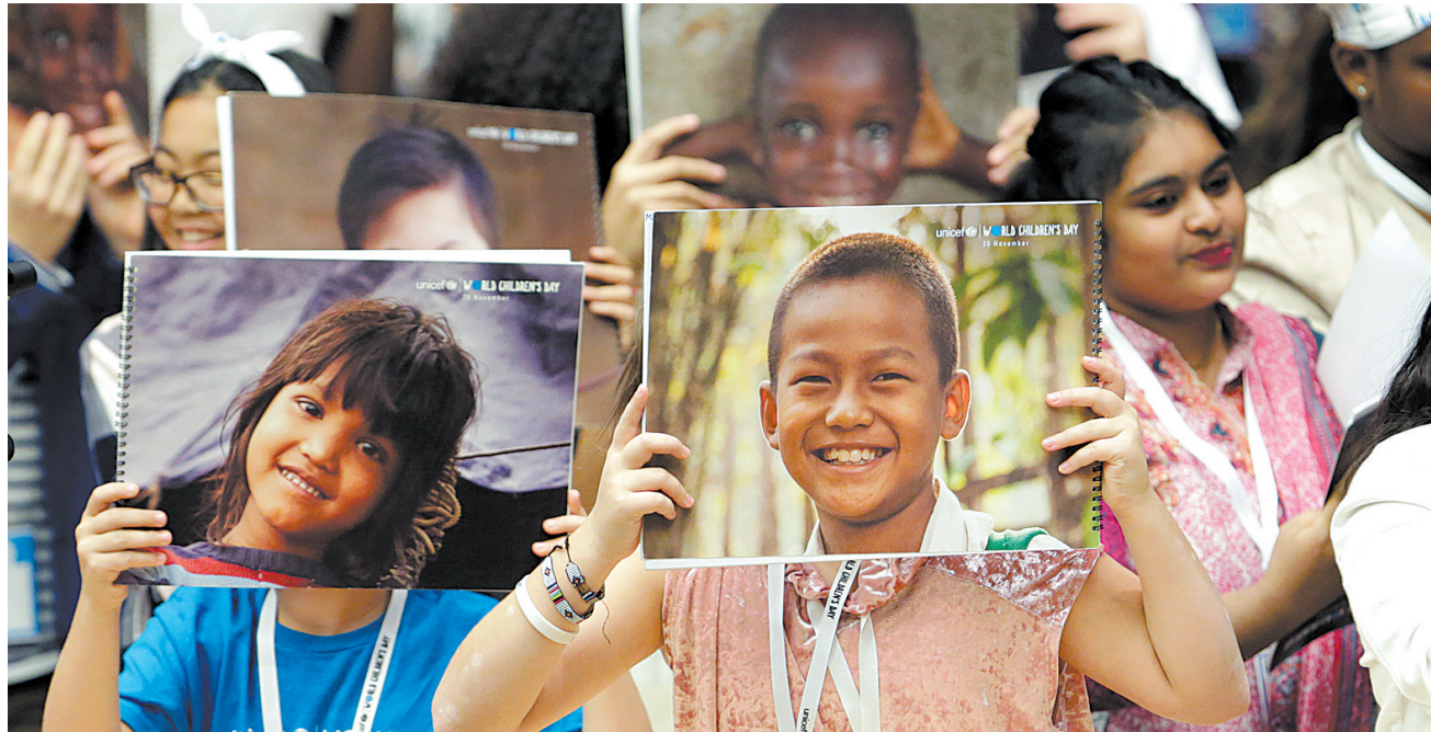
11月20日，在位于纽约的联合国总部，孩子们参加世界儿童日庆祝活动。

11月20日是世界儿童日，这一天，联合国被儿童“接管”：在会议大厅，他们大声发表自己的看法；在游客大厅和各大“景点”，到处是前来参观的少年儿童；联合国儿童基金会印制的“世界儿童日”各式海报更是随处可见。 当天，联合国秘书长古特雷斯和联合国儿童基金会执行主任莱克与来自纽约6所学校的约200名中小學生以及一些小游客在纽约联合国总部共同庆祝世界儿童日。 这一天，不同肤色的孩子们在联合国总部“当家做主”，向全