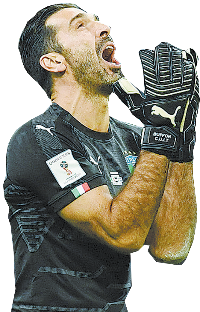
昨晨,意大利队守门员布冯仰天大喊。意大利队无缘俄罗斯世界杯决赛圈,赛后布冯宣布退出国家队。(新良)