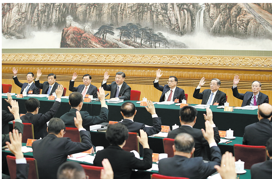
10月23日,中国共产党第十九次全国代表大会主席团在北京人民大会堂举行第四次会议。习近平同志主持会议。