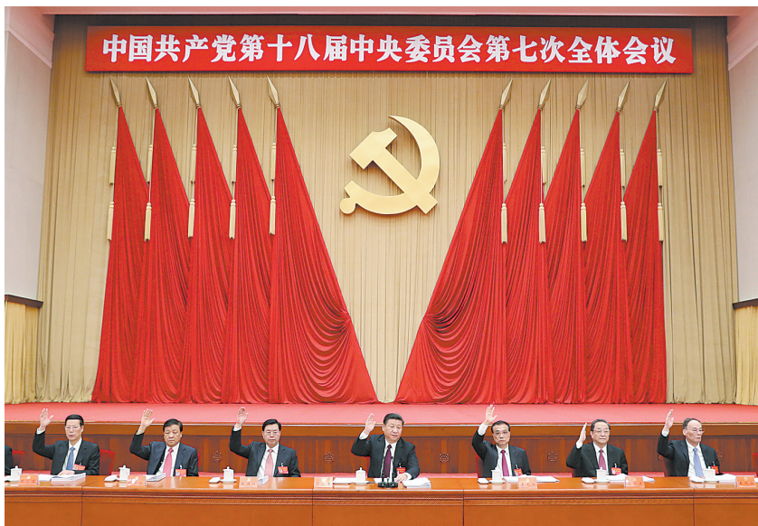
中国共产党第十八届中央委员会第七次全体会议,于2017年10月11日至14日在北京举行。这是习近平、李克强、张德江、俞正声、刘云山、王岐山、张高丽等在主席台上。

新华社北京10月14日电 中国共产党第十八届中央委员会第七次全体会议公报(2017年10月14日中国共产党第十八届中央委员会第七次全体会议通过)