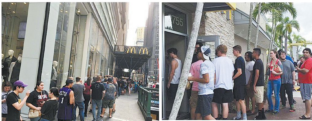
图为“特别限量版”四川辣酱及排队长抢购的食客。