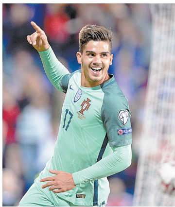
葡萄牙席尔瓦庆祝进球。