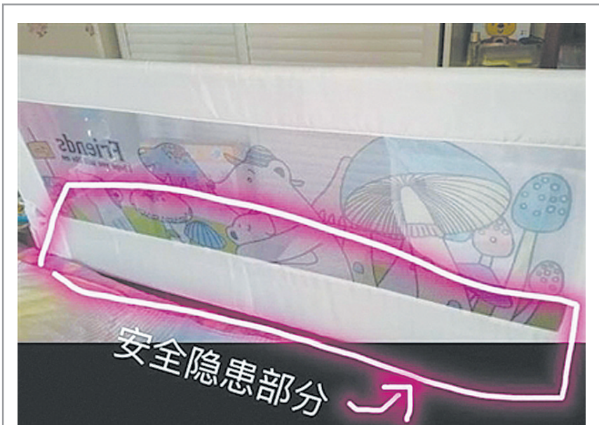
涉事围栏安装后和床之间有条明显的缝隙，存在安全隐患。

网帖发布后，立即引起热议。有人评论称，这款围栏，床垫和围栏之间有较大缝隙，自家的婴儿曾被多次卡在缝隙中。