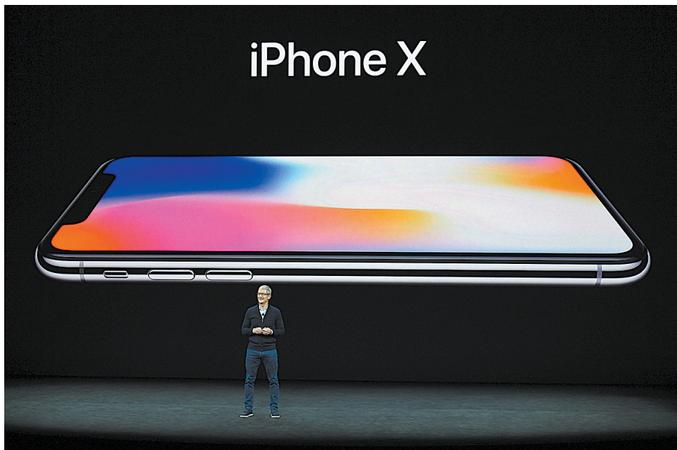
9月12日,在美国加州圣何塞市举行的苹果新品发布会上,苹果公司首席执行官蒂姆·库克介绍新推出的苹果手机iPhone X。

iPhone X搭载苹果自行研发的A11仿生芯片,不仅数据处理和图形处理性能比上一代芯片A10更快,还包含每秒运算6000亿次的神经网络引擎,通过机器学习支持脸部识别功能辨