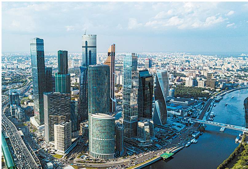
俄罗斯莫斯科国际商务中心楼群