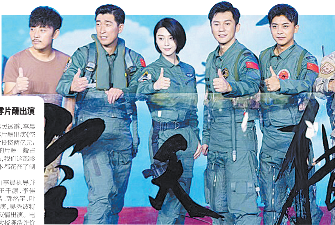
《空天猎》主创穿空军军装亮相