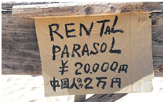
“太阳伞租赁20000日元仅限中国人”的告示