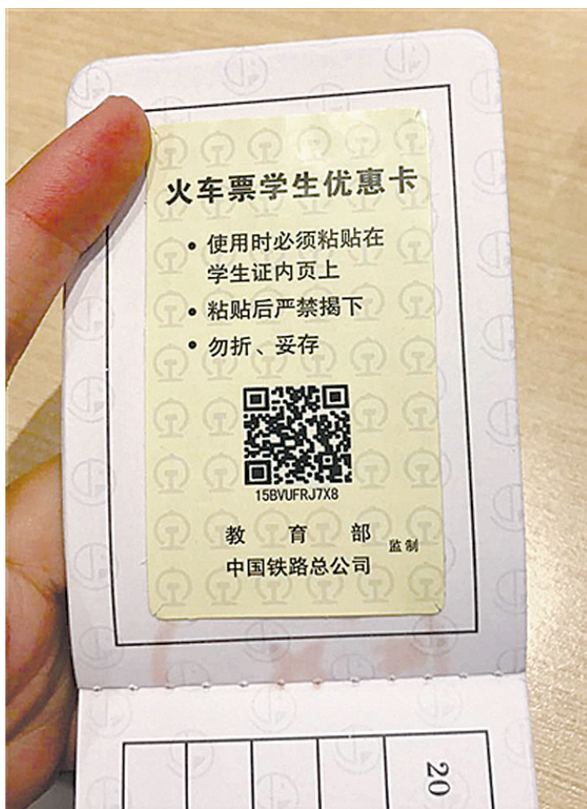
假学生证上的真“优惠卡”可以买到学生票