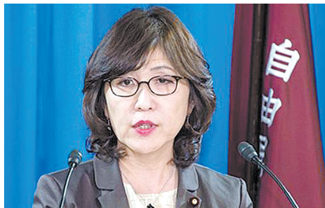
稻田朋美(资料照片)

报道称，日本特别防卫监察针对PKO问题的调查结果将于28日公开，稻田朋美认为其本身应承担监管责任，因此决定辞去防卫相，预计28日向日本首相安倍晋三提交辞呈。