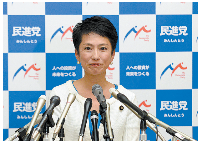
7月27日，在东京，莲舫回答记者提问。新华社记者 马平 摄