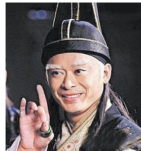
影视剧《明朝的太监》

公元1505年四月，身体一直不好的明孝宗患病，诏大学士李东阳、刘健等为顾命大臣。五月，明孝宗驾崩，年仅36岁。明孝宗15岁的长子朱厚照即位，是为明武宗，年号正德。正是由于新任皇上年纪尚轻，周围聚集了一大批太监陪着他东游西逛，影视剧中经常出现的大太监刘瑾就是这个时代的代表人物。