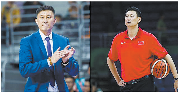
中国男篮蓝队主帅杜锋(左)和红队主帅李楠(资料图片)

同，这也是两队首次面对“统一试题”。可以想见，这3场比赛过后的战绩比较，也将是两队间的一