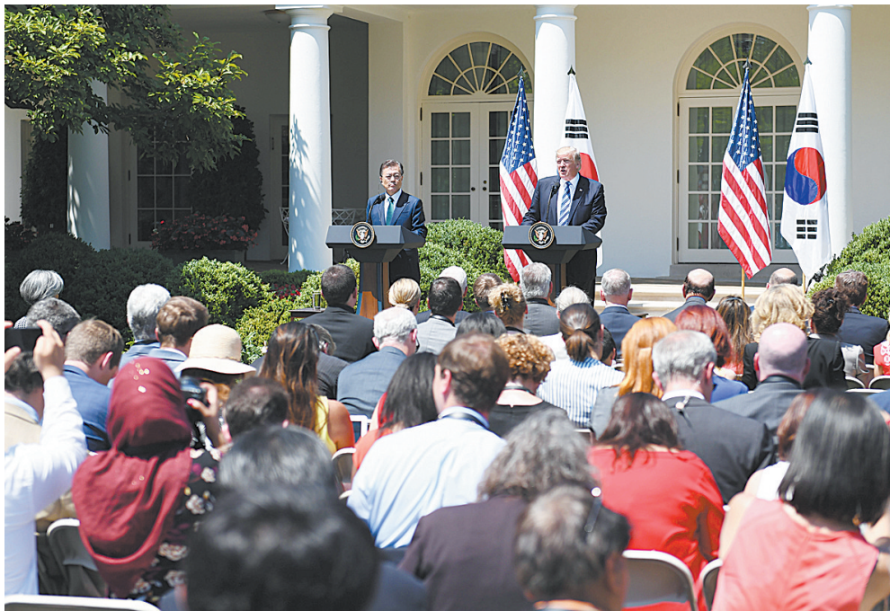
在美国华盛顿白宫，美国总统特朗普(右)与韩国总统文在寅出席联合新闻发布会。

此外，据韩国媒体报道，特朗普声称双方正在就自贸协定重新谈判，并在社交网络上发帖称要签订“一个新的贸易协定”。美方官员也称美方正在组建联合特别委员会会谈机制，以启动谈判并修改自贸协定。但韩方则否认两国领导人在会谈中就重新开展自贸谈判达成一致。韩国媒体认为，这显露了两国在“重谈自贸协定方面的裂痕”，重谈协定以及韩方作出利益妥协或将无法避免。