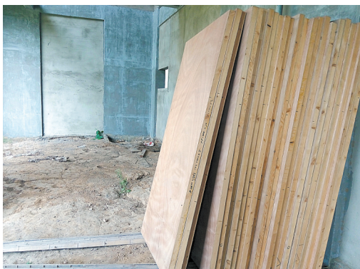
一楼工程仍没完工