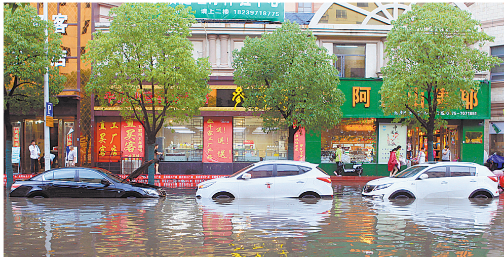
6月21日,一场突如其来的暴雨使市区多处低洼地段严重积水,园林路西段,不少机动车被淹。

据平顶山世纪丰田汽车4S店技术总监董哲介绍,暴雨天气遇到积水路面要观察。当水深为轮胎的三分之一高度时,可放心通过,只要车主操作正确,不会造成不必要的损失。当水深超过轮胎一半高度时,车主就要小心了,因为这