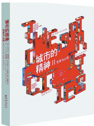
《城市的精神 II：包容与认同》 (加)贝淡宁 著 (以)艾维纳 主编 重庆出版社

6月16日，全球知名政治学者贝淡宁和社会学教授艾维纳携两人合作的新书《城市的精神 II：包容与认同》，在启皓北京河岸剧场举行了一场名为“城市的精神：为什么城市气质在全球化时代如此重要？”的演讲，探讨何为“城市气质”，以及在城市深刻塑造人类的生命价值与身份认同的今天，人们应该如何热爱自己