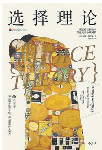
《选择理论》 作者：(美)威廉·格拉瑟 版本：后浪 | 江西人民出版社

文艺复兴之前的中世纪时代，是黎明前的黑暗时刻，充斥着无穷无尽的迷信、暴力和反智，上层建筑着迷火刑、谋杀和享乐，下层人民相信魔术和巫术，对自己肉身的脆弱和思想的愚昧无知无觉。而这个黑暗的时刻却是个等待光明破晓而出的分水岭。不久之后，文艺复兴的旋风将要刮起，大航海时代即将拉开帷幕，麦哲伦将航行到世界的边缘，一个现代欧洲正在襁褓中。《光荣与梦想》的作者、美国通俗历史学家威廉·曼彻斯特写下这本关于中世纪历史的通俗之作，带领我们领略波澜壮阔的欧洲文明如何从中世纪的黑暗中涅槃重生。