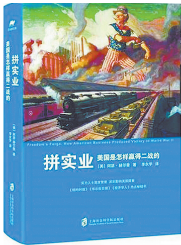
《拼实业：美国是怎样赢得二战的》 (美)阿瑟·赫尔曼 著 上海社会科学出版社

以我的阅读经验而言，《拼实业：美国是怎样赢得二战的》只是揭示了一些历史事实，而并非秘密：战场的背后是实业的较量。