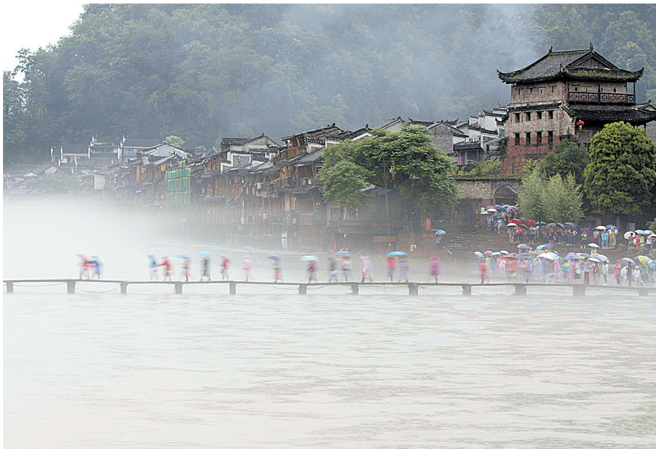
烟雨凤凰 6月24日,受持续阴雨天气影响,湖南湘西凤凰古城沱江河面水雾缭绕,如梦似幻。

活动主办方介绍,民俗文化月活动月期间,各景区景点还将举办土家摸米女儿会、土家情歌对唱,黄龙音乐季、土家民俗体验、狐仙寻亲、云顶赶歌会等日常活动。而同期举办的中国湖南张家界国际网红直播旅游节,采用网红直播和全民直播形式进行旅游推介宣传。张家界不仅拥有绝版山水,还有着浓郁而独特的民族文化和民俗风情,全市共有46个少数民族,少数民族人口占总人口的75.28%,民俗文化十分浓厚,全市共有15大类780项非物质文化遗产。在张家界,代代传承着情歌对唱、“哭嫁”等独特的民俗。