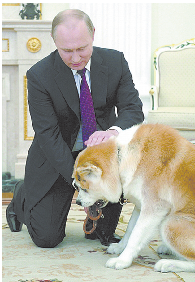
2016年12月7日,普京在克里姆林宫接受日本媒体采访前与自己的秋田犬玩耍。

谈及生死,普京说:“唯有上天知道你我的宿命。人都会死。问题是,在这个易逝的世间我们