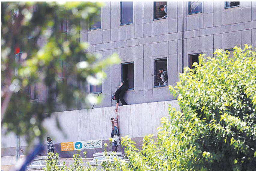
议会大楼中的民众互相救助,通过窗户逃离现场。