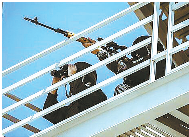
武装人员从高处瞄准议会大楼内的恐怖分子

霍梅尼陵位于德黑兰市南郊,距离伊朗议会大楼约25公里。此次对于霍梅尼陵的袭击是具有象征性的。作为伊朗伊斯兰共和国的创始人和首任最高领袖,霍梅尼领导了1979年革