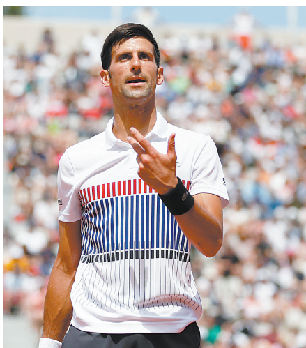
►德约科维奇在比赛中。