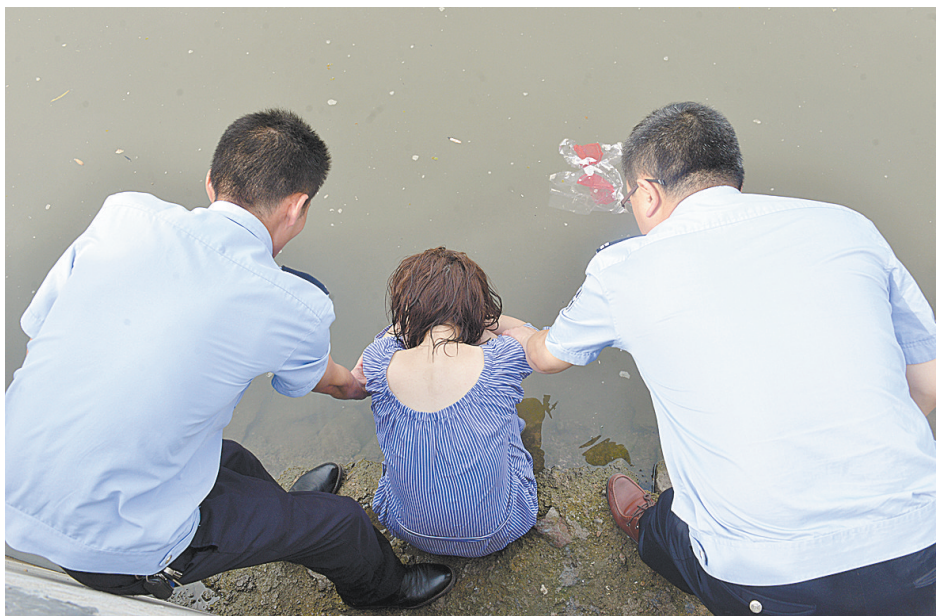
民警在劝说轻生女子。

记者急忙拨110求助,接话员说已经有人打过电话,民警马上就会到。8点50分,中兴路派出所几名民警接110指令赶到现场,从亲水步道上跳下去劝解女子,女子却不愿上岸。民警问她姓名和家庭住址,她回答“不知道”,只是说了一个手机号码让民警打,民警打了却发现关机。一番劝解之后,女子无动于衷,民警只好将她抬上了岸,引来她的一番挣扎和哭闹。随后,女子坐在二平台下面的斜坡上,低头抱肩,不理睬民警和围观群众的好意劝说。民警说:“你有啥事想不开?说出来我们可以帮帮