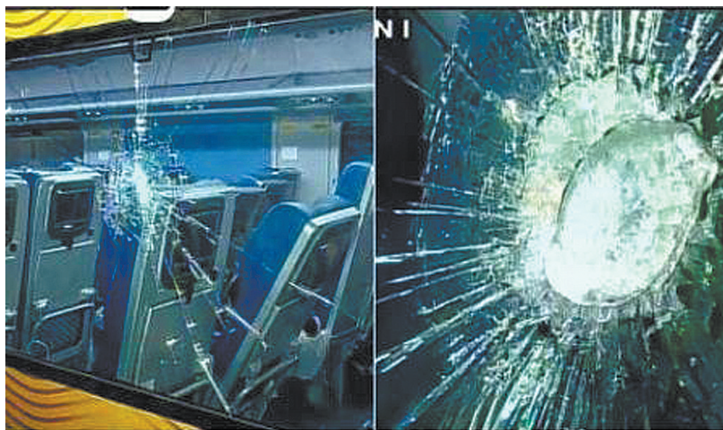
“光辉特快”豪华列车通车仅一周窗户就被打破了