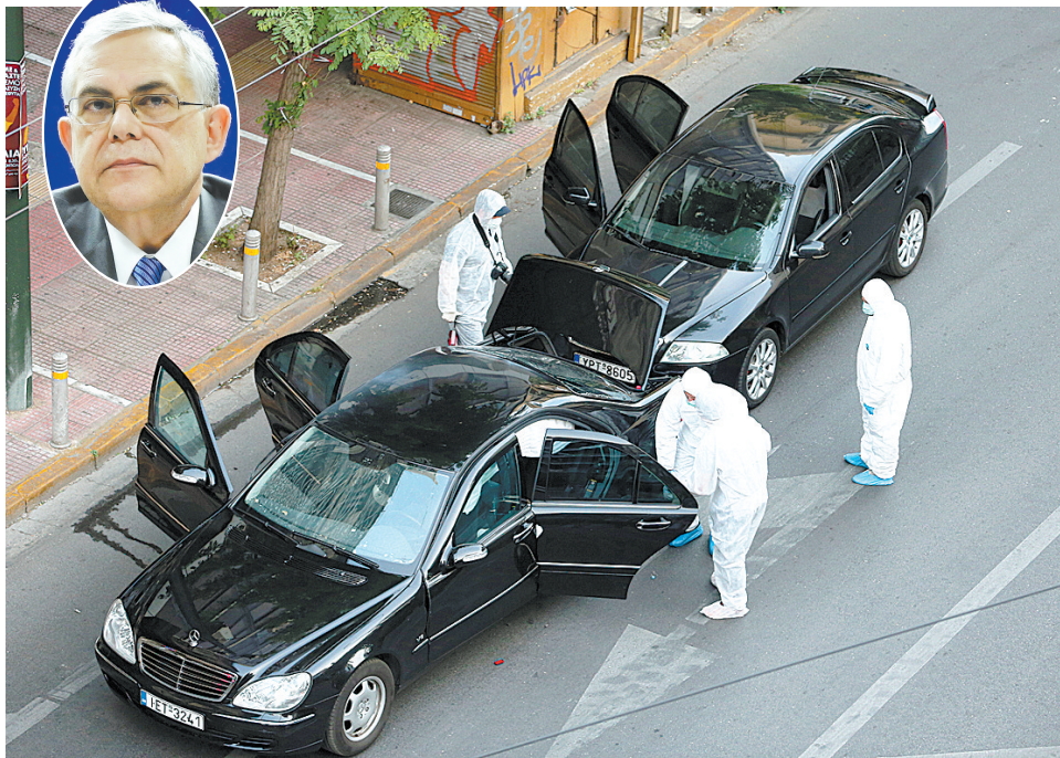
5月25日,在希腊雅典,反恐专家在事故现场进行调查。左上角小图为帕帕季莫斯资料照片。

起针对政治、金融和警察目标的攻击事件,一个名为“火屋阴谋”的希腊恐怖组织宣称若干起邮件炸弹事件是他们所为。该组织还声称今年3月份把邮件炸弹寄到