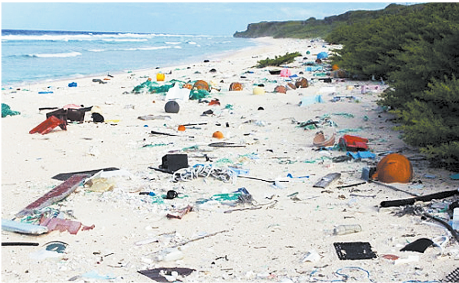
垃圾遍地的亨德森岛

研究发现,最常见的垃圾是打火机和牙刷,还有玩具和婴儿奶嘴。专家警告,鱼类、海龟、海鸟吃了塑料后可致命。