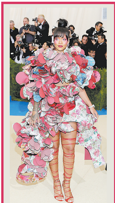
▼ 超模刘雯薄纱牛仔性感袭人