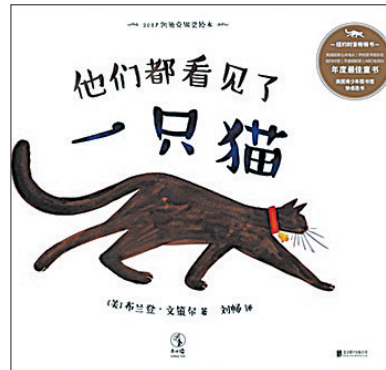
《他们都看见了一只猫》 作者：(美)布兰登·文策尔 译者：刘畅 版本：北京联合出版公司

绘本是孩子了解这个世界、形成最初兴趣乃至世界观的重要途径。每一本优秀的绘本在为孩子讲述形形色色故事的同时，也会启发他们的想象力，给予他们看待世界的智慧，《他们都看见了一只猫》就是这样一个绘本。这本书的故事很简单：一只猫满世界行走，被其他动物一一看到。