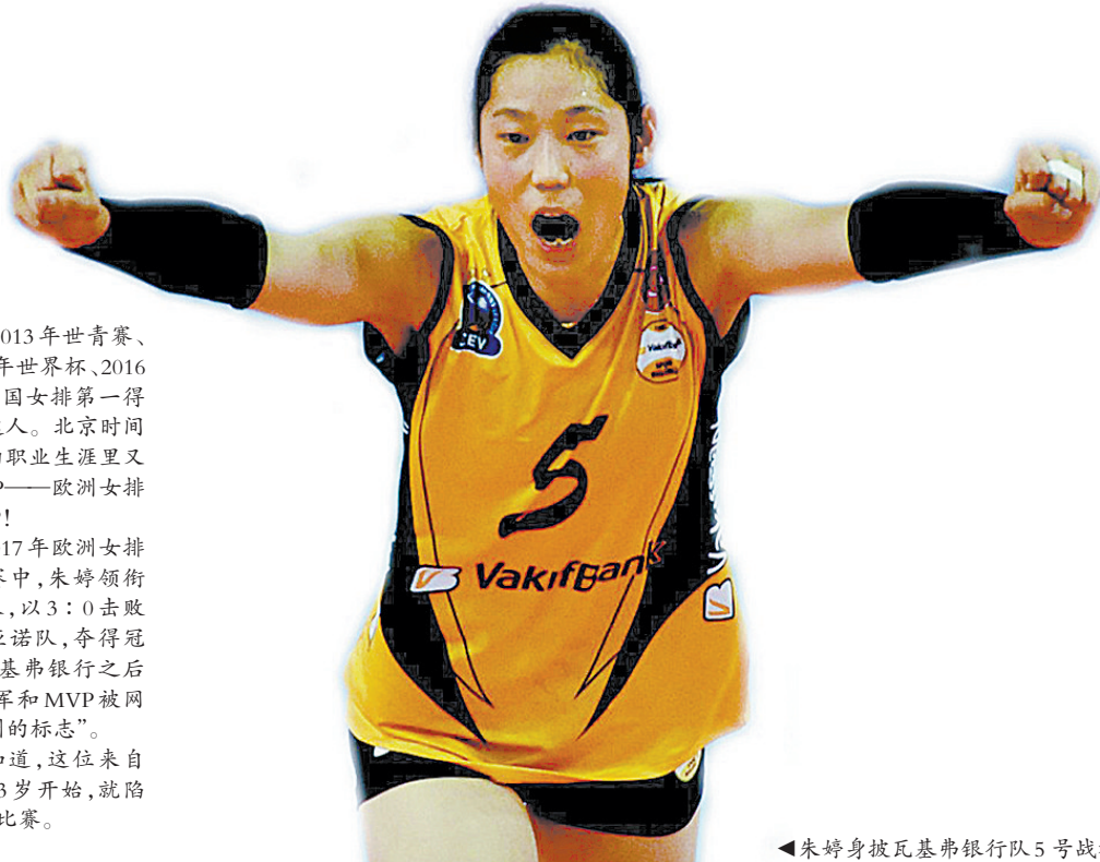
▲朱婷身披瓦基弗银行队5号战袍

2012年亚青赛、2013年世青赛、2015年亚锦赛、2015年世界杯、2016年里约奥运会……中国女排第一得分手朱婷可谓MVP达人。北京时间4月24日凌晨，朱婷的职业生涯里又收获一个重要的MVP——欧洲女排俱乐部冠军联赛MVP！