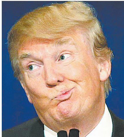
“说得跟真的似的,我差点都信了!”