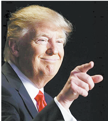
“你看,我就说韩媒发的是假新闻吧!”