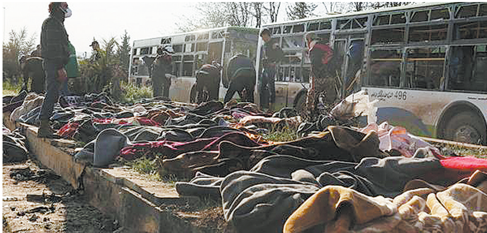
载有数千名什叶派撤离人员的车队 4 月 15 日在叙利亚阿勒颇以西遭自杀式汽车炸弹袭击。

目击者向叙利亚媒体透露,孩子们被袭击者发放的薯片吸引过去,之后便发生了爆炸。一名在爆炸中受伤并失去 4 个兄弟姐妹的小女孩说,多年饱受饥饿折磨的小伙伴们一听车上的男子说可以吃薯片,就凑到他周围,随后他便引爆了炸弹。(国日)