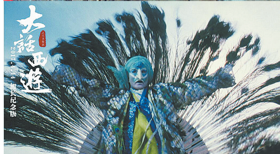
身着蓝色緞边长袍的外来孔雀妖怪