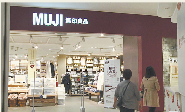
无印良品被曝出售来自日本核污染区的食品