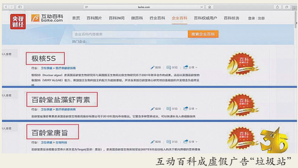
互动百科成虚假广告“垃圾站”

今年央视3·15晚会为消费者揭露了一批侵害消费者权益的行为和现象。其中包括互动百科成虚假广告“垃圾站”；无印良品、永旺超市等销售来自日本核污染区的食品；饲料企业往饲料中非法添加各种“禁药”；“三无体检队”为几百所中小学进行体检；耐克所售产品与描述不符等，种种侵权行为令人触目惊心。