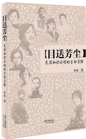
《目送芳尘——民国知识女性的生命寻踪》 齐红 著 广东人民出版社

民国史所以值得重视,多因其作为现代中国之开始,社会面貌、特征既与传统中国颇不相同,而国人之生活、命运及自我意识亦大为改变。我是谁,我当成为谁,我当如何存在,此类问题之回答,民国时人已于传统难寻现成答案,而必待自身去观察、思索与实践。如是可谓国人之心灵生活遭遇前所未有之挑战,必待凭一己之努力去完成个人主体人格与存在意义之重建。此于中国女性,意义不可谓不为重大。