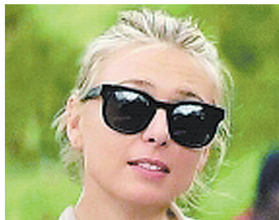
俄罗斯美女莎拉波娃