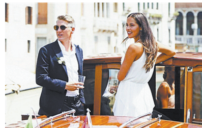
施魏因施泰格和伊万诺维奇