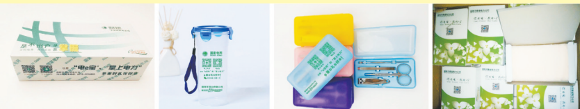
礼品1:柔软纸抽 礼品2:便携水杯 礼品3:指甲刀套装 礼品4:一条装毛巾

一、下载方式:手机扫一扫下图二维码、app手机应用 二、广大电力客户下载注册“电e宝”、“掌上电力”后,凭网上交费手机截屏到就近供电营业厅领取,也可到供电营业厅现场办理。 三、活动时间:2016年12月19日起至活动礼品赠完为止。 四、活动礼品领取地址: 1.新华路与湛南路交叉口向南200米新华路供电营业厅; 2.新城区祥云路与和谐路交叉口国家电网供电营业厅; 五、供电服务咨询电话:国网平顶山供电公司24小时服务热线0375-2768888。