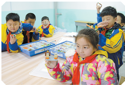
拼装玩具,学生们在玩中学习