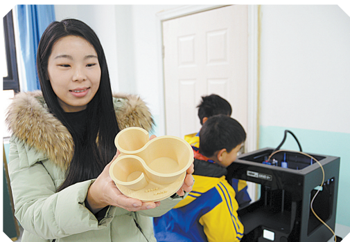
师生利用3D打印机打印出的第一件工艺品