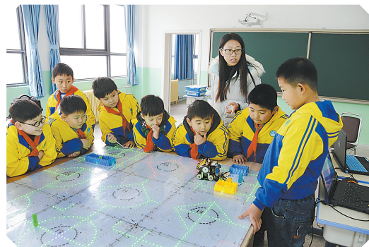
给机器人编程,使其按照程序完成指定搬运动作