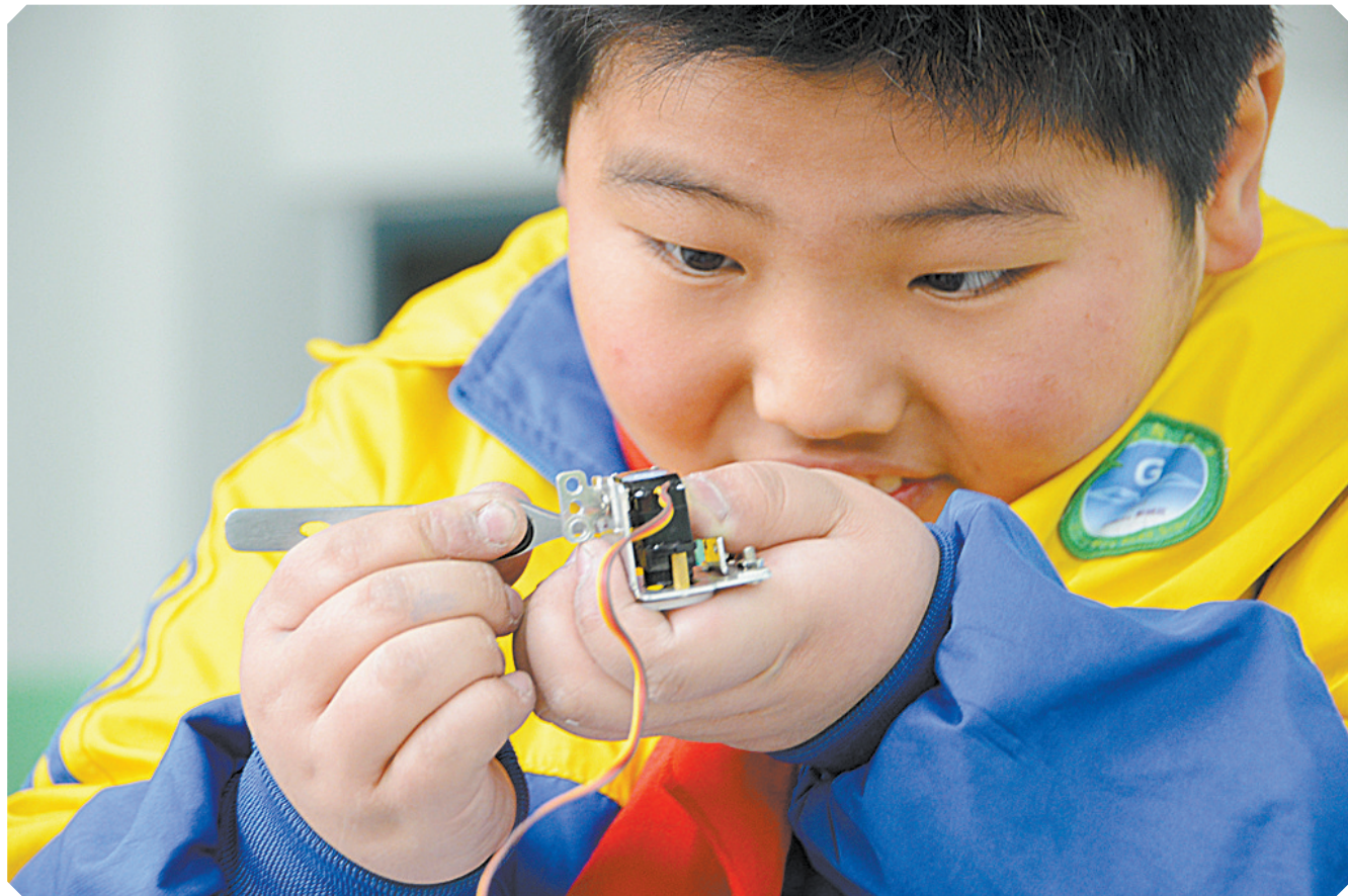
学生在细心修复机器人部件