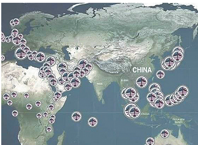
美军基地用导弹、轰炸机、军舰等形成了一个包围中国的巨大绳索

美国军机无休止地在冲绳上空飞过，有时还会掉入民居和学校，导致“人们不得安眠、老师无