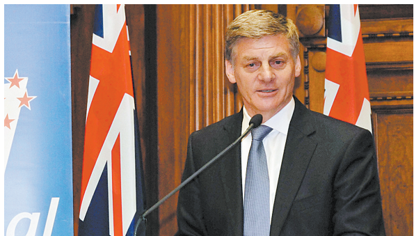
12月12日，新西兰执政党国家党新任党首比尔·英格利希在惠灵顿出席新闻发布会。

随着约翰·基“挥一挥衣袖，不带走一片云彩”，12月12日，新西兰副总理兼财政部长比尔·英格利希(Bill English)在总督帕齐·雷迪女爵士的见证下，宣誓成为新西兰第39任总理。